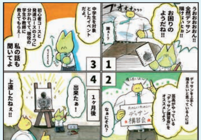
(原画 3年 マンガ・キャラクターコース生徒作品)