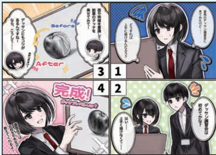
(原画 3年 マンガ・キャラクターコース生徒作品)