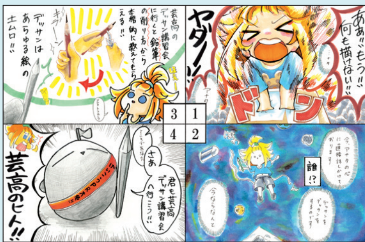
(マンガ文化表現コース 3年生作品)