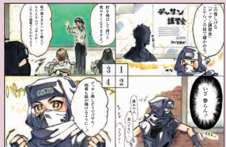
(マンガ文化表現コース3年生作品)