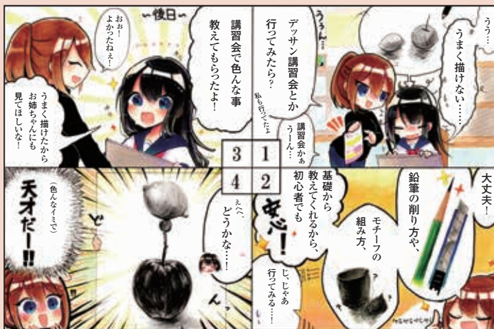
(マンガ文化表現コース3年生作品)