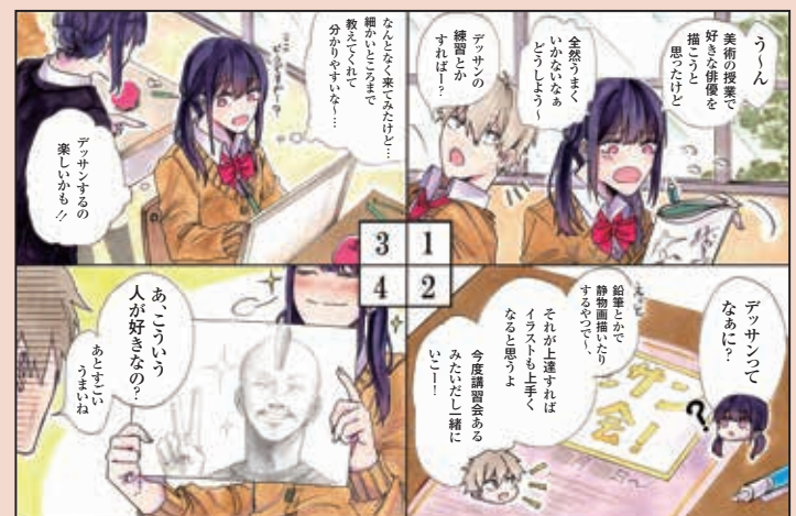
(マンガ文化表現コース3年生作品)