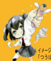
イメージキャラクター「つばきちゃん」

■ 絵画表現コース ■ マンガ文化表現コース ■ 造形表現コース ■ 視覚デザイン表現コース ■ 映像メディアデザイン表現コース