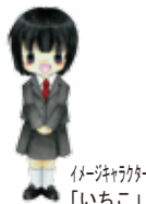
イメージキャラクター「いちご」